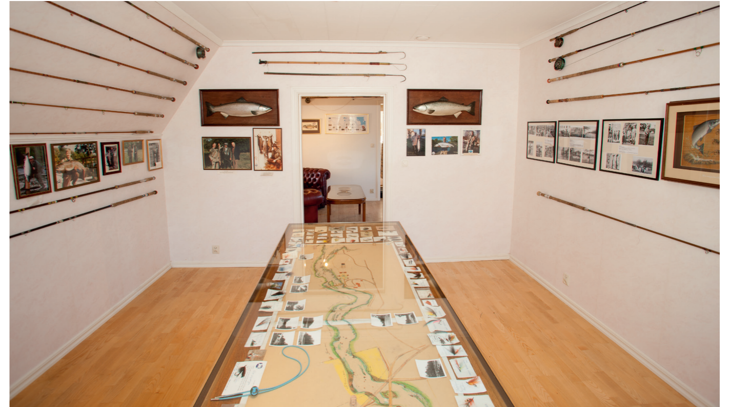
»Rod room« i det nya museet där det stora glasbordet med den gamla poolkartan placerats tillsammans med ett urval spön.

INNAN JAG AVSLUTAR artikelserien, så har tiden absolut inte stått still vare sig vad det gäller samlingarna eller själva prylarna runt fiskevärden och sportfisket. GUS försöker utveckla det hela vid sidan av fiskevårdsarbetet, även om vi bara har små medel. Senast var det poolkartan »Fisherman's Map« som togs fram till GUS