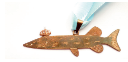
Gäddorden - bet det på en gädda fick man bjuda på middag samt bära denna mässingsgädda till smokingen.

EN AV DE småsaker som vi till slut lyckades bena ut under resans gång var en decimeterlång gädda av mässing. Vi hittade av en slump några spridda anteckningar härstammandes från den första flytten 2001 där Göran förklarade närmare om det så kallade gäddordens-